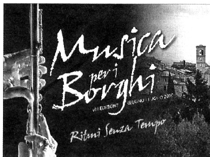
A sinistra Paola Turci, in concerto il 17 a Deruta, suonerà le canzoni dal nuovo album e i successi del passato. In basso la locandina della manifestazione

puntamento lascia campo libero alla musica jazz, classica e world & soul. Dalle due serate verranno prescelti due artisti o band che parteciperanno all'ultima serata del festival, mentre tutte le esibizioni verranno registrate e pubblicate sul sito Jml. È prima del gran finale, a Marsciano saranno protagoniste le tradizionali taverne aperte con gli artisti di strada, nelle serate di mercoledì